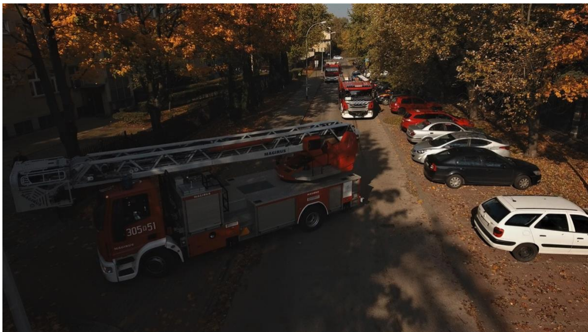
Fot. Jednostka Ratowniczo-Gaśnicza nr 5 w Warszawie laureat nagrody w kategorii instytucjonalnej ANIMUS FORTIS (Mężny Duch) 2022

Jednostka brała również czynny udział w zdarzeniach związanych z konsekwencjami konfliktu zbrojnego na Ukrainie. Strażacy, pełniąc całonocne dyżury na dworcach znajdujących się na terenie całej Warszawy, pomagali uchodźcom realizując czynności medyczne oraz organizacyjnie, tak by w efekcie zapewnić im miejsce schronienia.