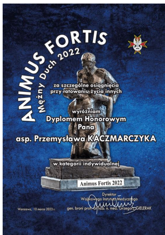
Fot. Dyplom honorowy Animus Fortis 2022