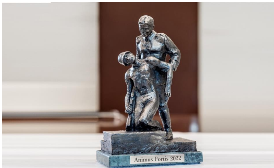
Fot. Statuetka Animus Fortis 2022