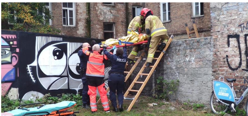
Fot. Jednostka Ratowniczo-Gaśnicza nr 5 w Warszawie laureat nagrody w kategorii instytucjonalnej ANIMUS FORTIS (Mężny Duch) 2022