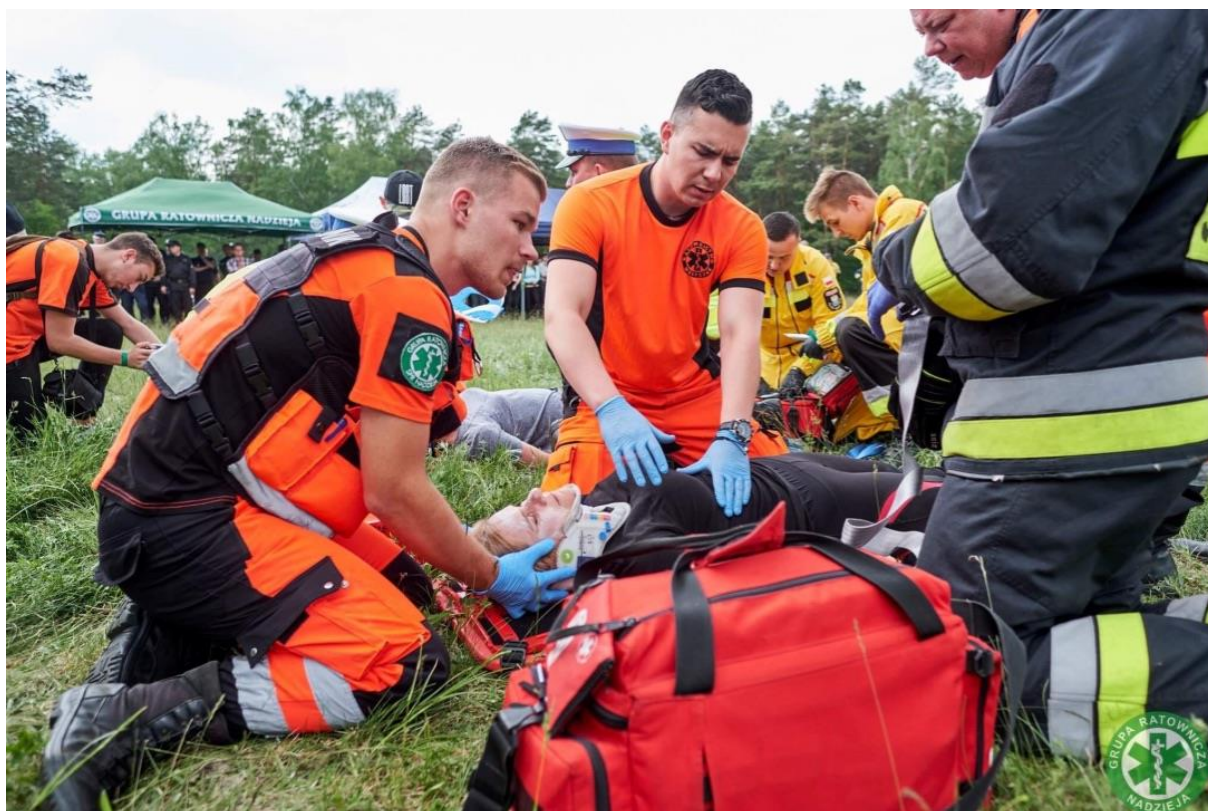
Grupa Ratownicza Nadzieja – laureat nagrody w kategorii instytucjonalnej ANIMUS FORTIS (Mężny Duch) 2020

Stowarzyszenie funkcjonuje we wszystkich systemach ratownictwa i bezpieczeństwa na terenie północno-wschodniej Polski. Pozostaje w ciągłej dyspozycji Centrum Powiadomiania Ratunkowego reagując na zgłoszenia Państwowego Ratownictwa Medycznego, niosąc pomoc osobom znajdującym się w stanie zagrożenia życia i zdrowia. Na podstawie zawartych porozumień współpracuje z Krajowym Systemem Ratowniczo-Gaśniczym udzielając wsparcia Państwowej Straży Pożarnej. Ponadto współdziała z Centrum Poszukiwania Osób Zaginionych Komendy Głównej Policji w Warszawie. Dodatkowo na terenie woj. Podlaskiego gotowi są na wezwania Centrum Zarządzania Kryzysowego w związku z wystąpieniem katastrof, kataklizmów, ewakuacją lub zapewnieniem bezpieczeństwa ludności. Grupa „Nadzieja” ma status Ochotniczej Straży Pożarnej.