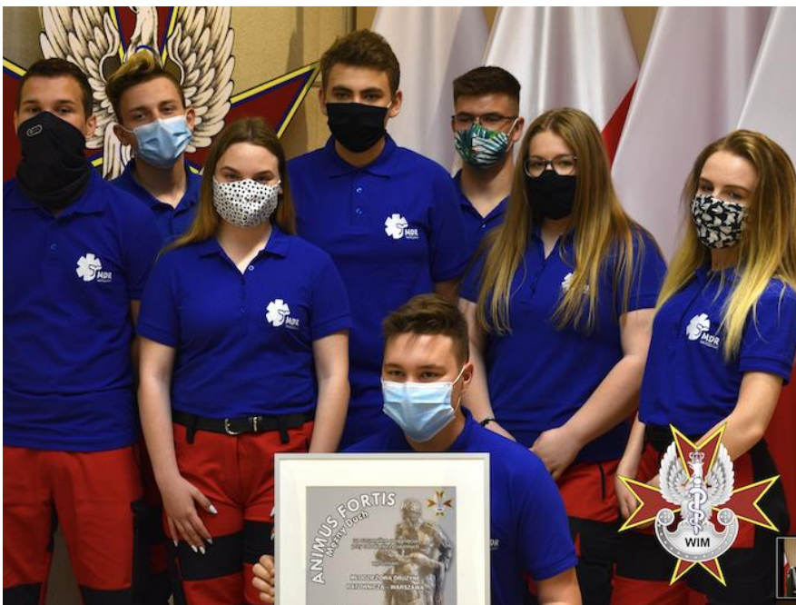
Fot. Dyplom Honorowy odbierają przedstawiciele Młodzieżowej Drużyny Ratowniczej - Warszawa