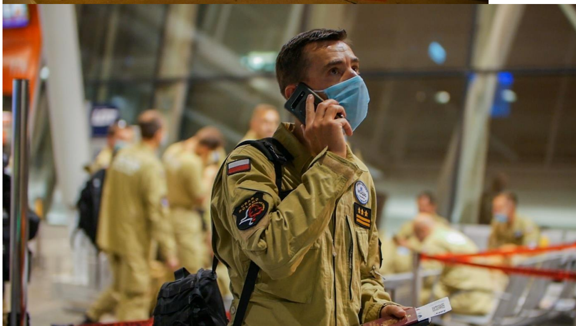
Fot. Rządowa Agencja Rezerw Strategicznych – wyróżniona dyplomem honorowym w kategorii instytucjonalnej ANIMUS FORTIS (Mężny Duch) 2020