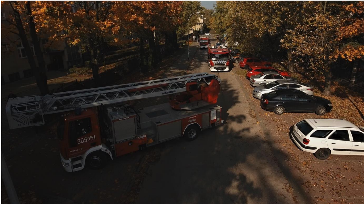
Fot. Jednostka Ratowniczo-Gaśnicza nr 5 w Warszawie laureat nagrody w kategorii instytucjonalnej ANIMUS FORTIS (Mężny Duch) 2022

Jednostka brała również czynny udział w zdarzeniach związanych z konsekwencjami konfliktu zbrojnego na Ukrainie. Strażacy, pełniąc całodobowe dyżury na dworcach znajdujących się na terenie całej Warszawy, pomagali uchodźcom realizując czynności medyczne oraz organizacyjnie, tak by w efekcie zapewnić im miejsce schronienia.