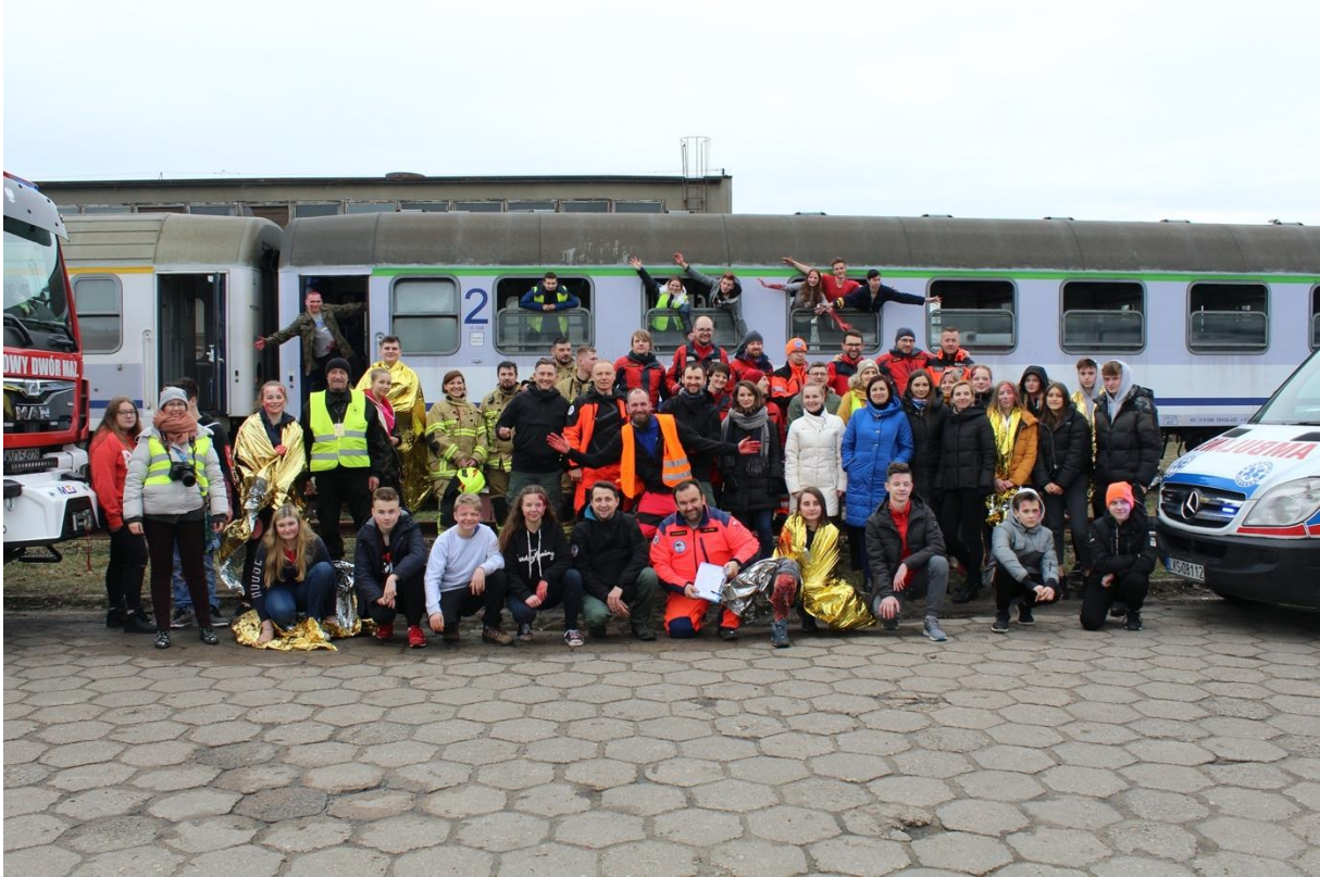
Młodzieżowa Drużyna Ratownicza laureat nagrody w kategorii instytucjonalnej ANIMUS FORTIS (Mężny Duch) 2019

Dyplomem honorowym nagrody Animus Fortis w kategorii instytucjonalnej wyróżniona została Młodzieżowa Drużyna Ratownicza – Warszawa, niezależna grupa młodzieżowa działająca przy Fundacji ANIKAR, zrzeszająca 30 młodych ludzi chcących rozwijać swoje pasje i zainteresowania związane z ratownictwem.