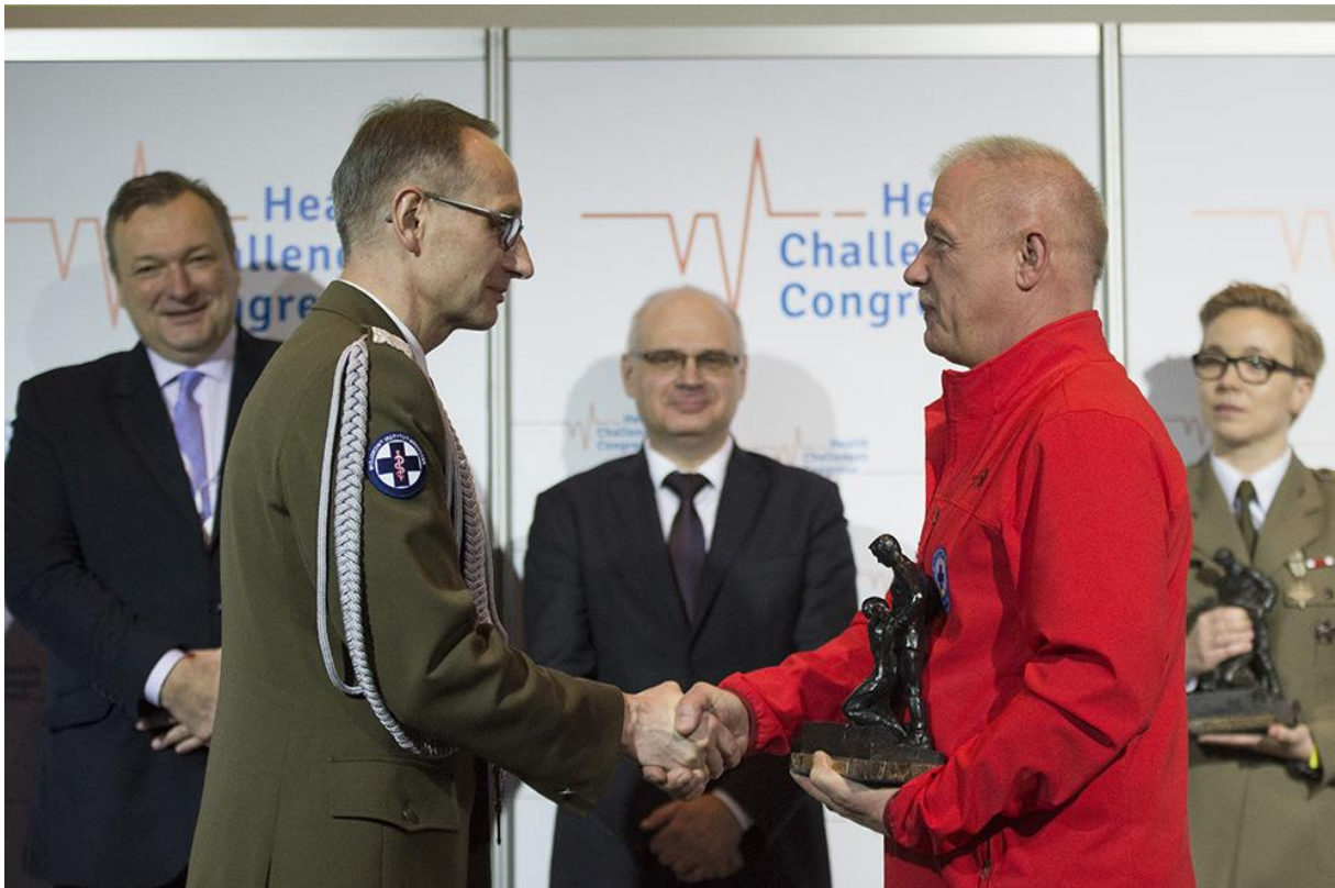
Fot. Nagrodę odbiera przedstawiciel Legionowskiego Wodnego Ochotniczego Pogotowia Ratunkowego

W 2002 roku z ich inicjatywy rozpoczęła działalność pierwsza w Polsce „Pływająca Karetka Pogotowia Ratunkowego”, a rok później powstała Grupa Ratowniczo-Poszukiwawcza Legionowskiego WOPR. Grupa działa cały rok zajmując się m.in. ratownictwem medycznym, lodowym i poszukiwaniami podwodnymi, a także organizacją szkoleń ratowników wodnych oraz z pierwszej pomocy. Latem Legionowski WOPR udziela pomocy ok. 200 osobom, biorąc udział w ponad 150 akcjach ratowniczych, organizują także spotkania z młodzieżą ucząc bezpiecznego wypoczynku na wodzie.