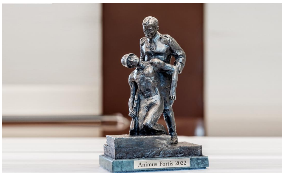
Fot. Statuetka Animus Fortis 2022