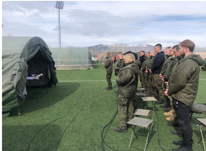
2 Wojskowy Szpital Polowy we Wrocławiu laureat nagrody w kategorii instytucjonalnej ANIMUS FORTIS (Mężny Duch) 2023