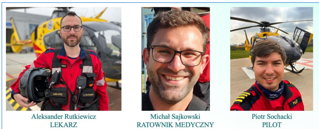
Załoga LPR – Ratownik 23 laureat nagrody w kategorii instytucjonalnej ANIMUS FORTIS (Mężny Duch) 2024

16 września 2024 r. załoga śmigłowca „Ratownik 23” z Filii Lotniczego Pogotowia Ratunkowego w Opolu uczestniczyła w akcji przeciwpowodziowej koordynując i prowadząc ewakuację pacjentów ze Szpitala Uzdrawiskowo-Rehabilitacyjnego w Łądku-Zdroju.