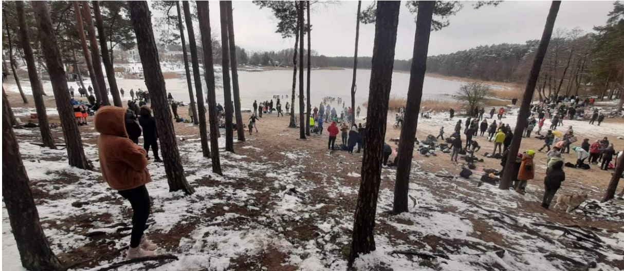
Fot. Miejsce morsowania