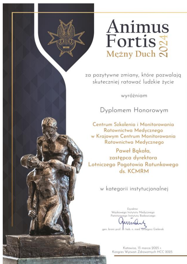
Dyplom Honorowy Animus Fortis 2024