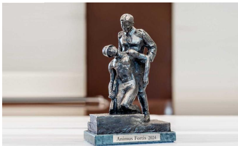
Statuetka Animus Fortis 2024