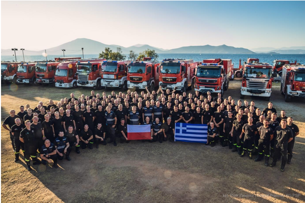
Komenda Główna Państwowej Straży Pożarnej w Warszawie wyróżniona Dyplomem Honorowym w kategorii instytucjonalnej ANIMUS FORTIS (Mężny Duch) 2021

Na początku sierpnia 2021 r. władze Grecji zwróciły się z prośbą do Polski o pomoc w walce z gigantycznymi pożarami wywołanymi długotrwałymi upałami.