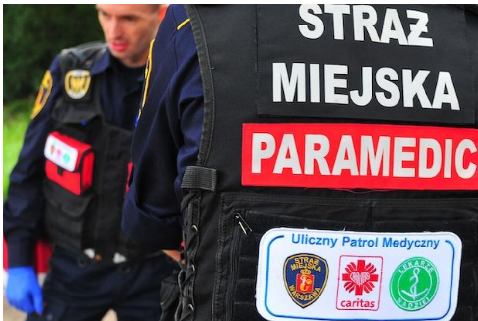
Uliczny Patrol Medyczny - laureat nagrody w kategorii instytucjonalnej ANIMUS FORTIS (Mężny Duch) 2019

Oznakowany radiowóz z ratownikami na pokładzie kilka razy w miesiącu dociera do odludnych i trudno dostępnych miejsc, gdzie nocują i przebywają bezdomni. Najczęściej są to opuszczone domy, budynki gospodarcze, altany działkowe, ale też sklecone z przypadkowych materiałów budy, szałas i ziemianki, które stają się namiastkami domu.