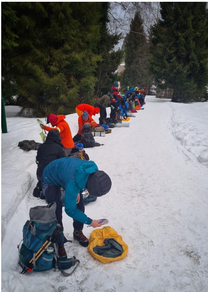
Fundacja Medyk Rescue Team „Bezpieczny Kazbek” - laureat nagrody w kategorii instytucjonalnej ANIMUS FORTIS (Mężny Duch) 2021

„Medyk Rescue Team” to zespół specjalistów wielu dziedzin w szeroko pojętym ratownictwie. Każdy jest ekspertem w swojej dziedzinie, począwszy od ratownictwa medycznego, poszukiwań zaginionych, poprzez ratownictwo wysokościowe, aż po górskie. Razem tworzą znakomity zespół gotowy do działania w każdych, nawet najbardziej wymagających warunkach.