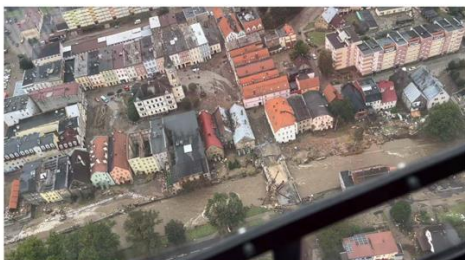
Zniszczone centrum Łądku-Zdroju sfotografowane w drodze do szpitala uzdrawiskowego

Trzeba z całą mocą wskazać, że sprawnie przeprowadzona ewakuacja pacjentów ze szpitala możliwa była jedynie dzięki ścisłej współpracy załogi „Ratownika 23” z personelem szpitala uzdrawiskowego, który pracował z dużym zaangażowaniem i poświęceniem, załogami śmigłowców policyjnych, ratownikami straży pożarnej na pokładach, a także Centrum Operacyjnym LPR i drugim śmigłowcem LPR „Ratownik 13”.