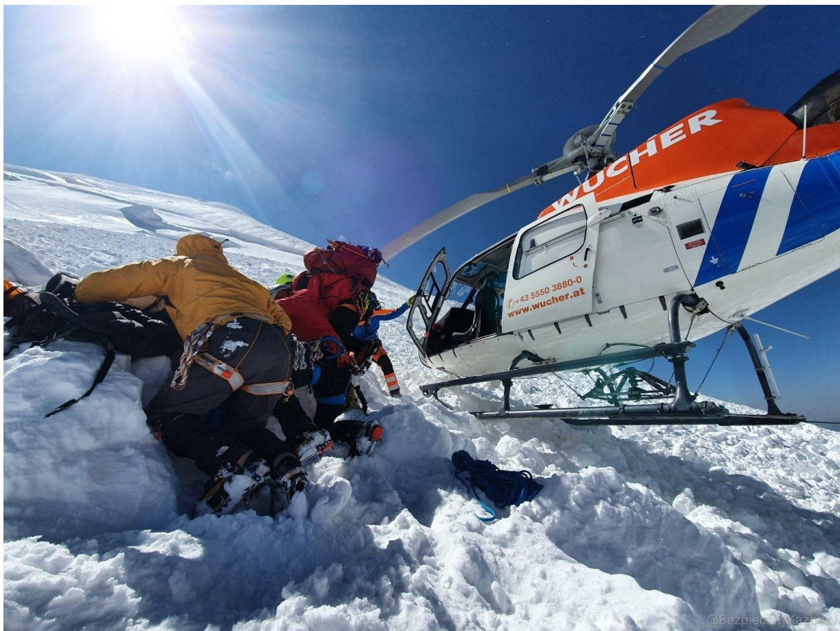
Fundacja Medyk Rescue Team „Bezpieczny Kazbek” - laureat nagrody w kategorii instytucjonalnej ANIMUS FORTIS (Mężny Duch) 2021