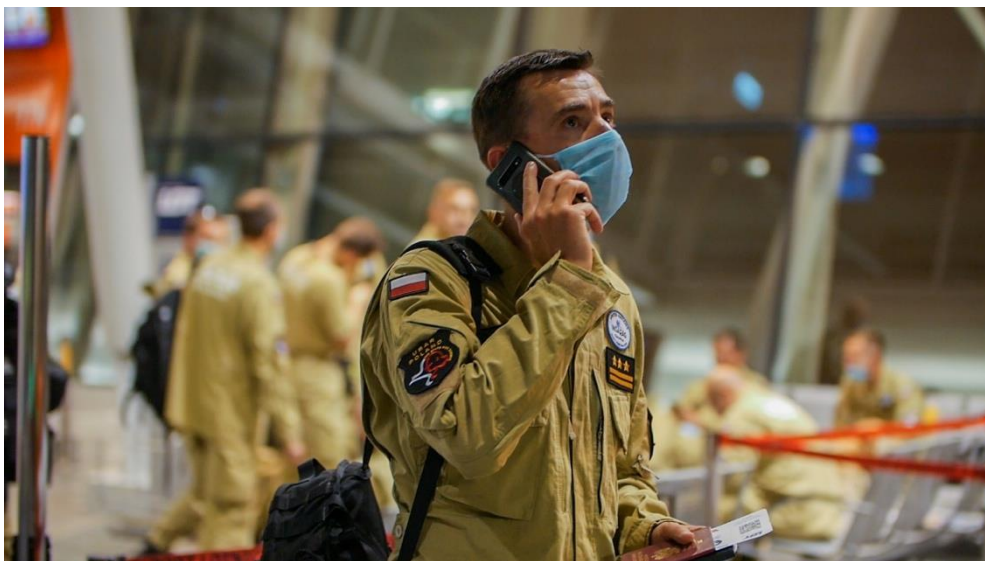
Rządowa Agencja Rezerw Strategicznych wyróżniona dyplomem honorowym w kategorii instytucjonalnej ANIMUS FORTIS (Mężny Duch) 2020