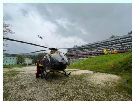
Na fotografii widoczne jest miejsce lądowania śmigłowców LPR – po prawej R23